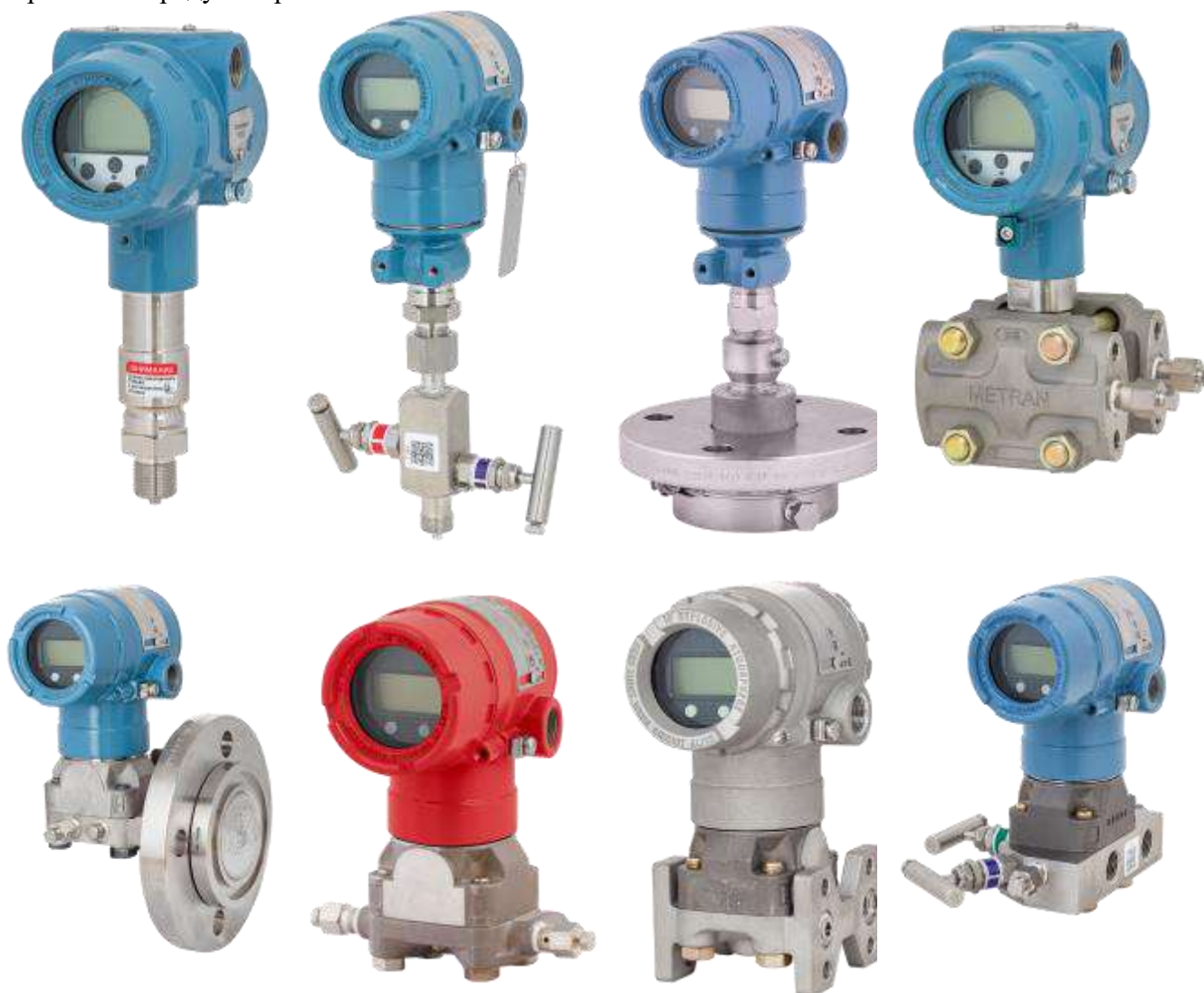
Рисунок 1 – Общий вид датчиков

Пломбирование датчиков не предусмотрено. Нанесение знака поверки на средство измерений не предусмотрено.