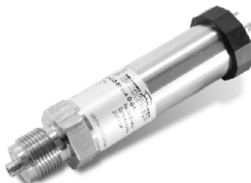
Рисунок 5 – Общий вид датчика давления CROCUS F

Пломбирование датчиков не предусмотрено.