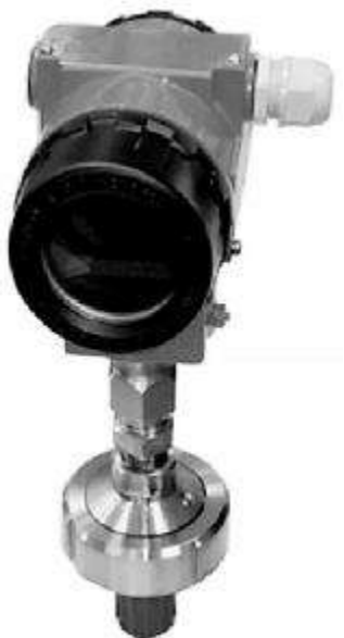
Рисунок 2 – Общий вид датчика давления CROCUS L с разделителем сред