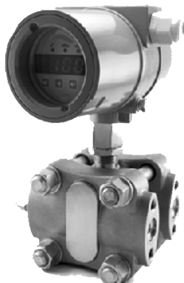
Рисунок 3 – Общий вид датчика давления CROCUS B фланцевого исполнения