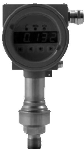
Рисунок 4 – Общий вид датчиков давления CROCUS B штуцерного исполнения