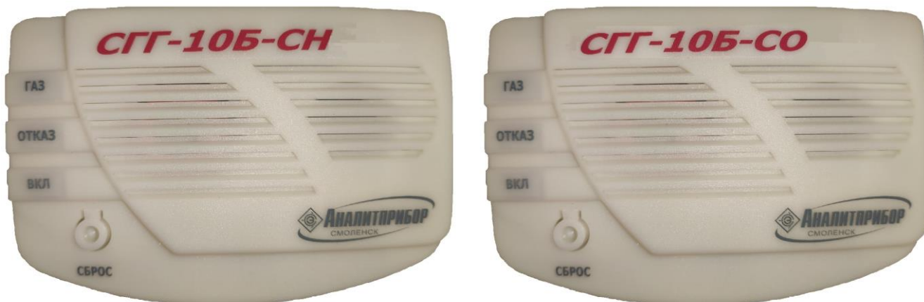
а) сигнализаторы СГГ-10Б-СН