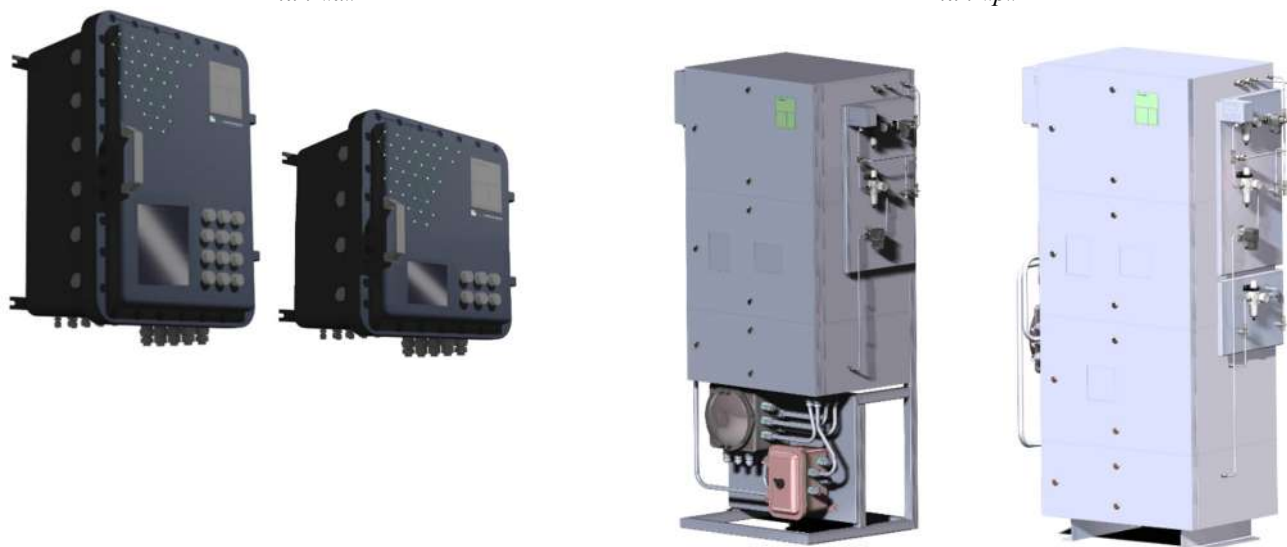
Рисунок 1 – Общий вид Газоанализаторов поточных ЭкоСпектр