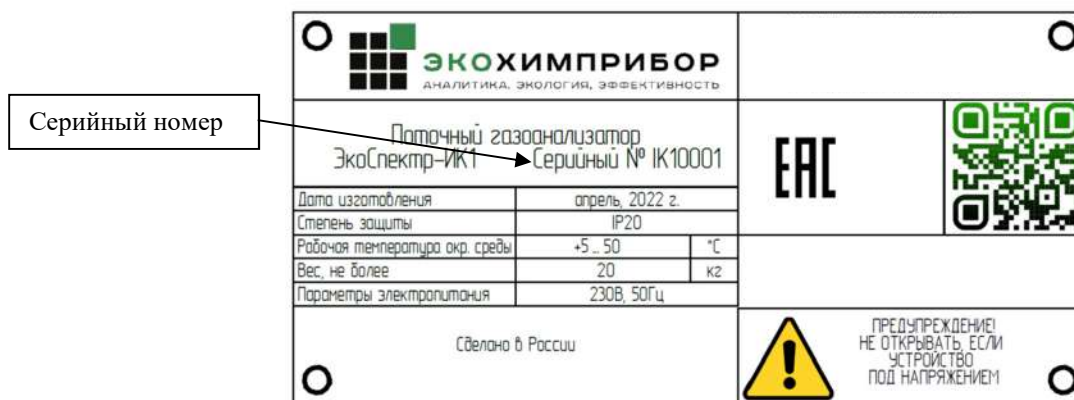
Рисунок 3 – Идентификационная табличка газоанализаторов