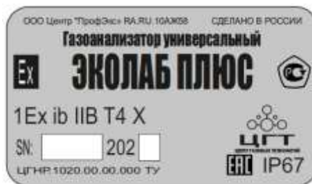
Рисунок 2 – Идентификационная табличка газоанализаторов