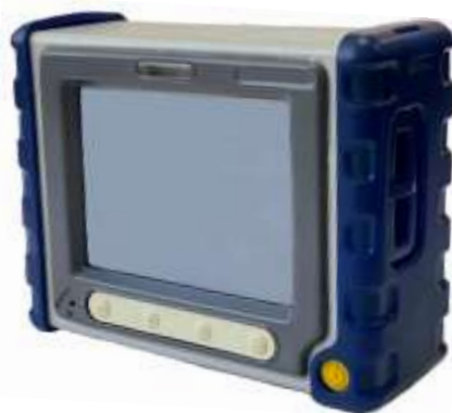
Рисунок 1 – Общий вид газоанализаторов универсальных Эколаб плюс

Общий вид газоанализаторов представлен на рисунке 1. Схема пломбировки от несанкционированного доступа представлены на рисунке 3.