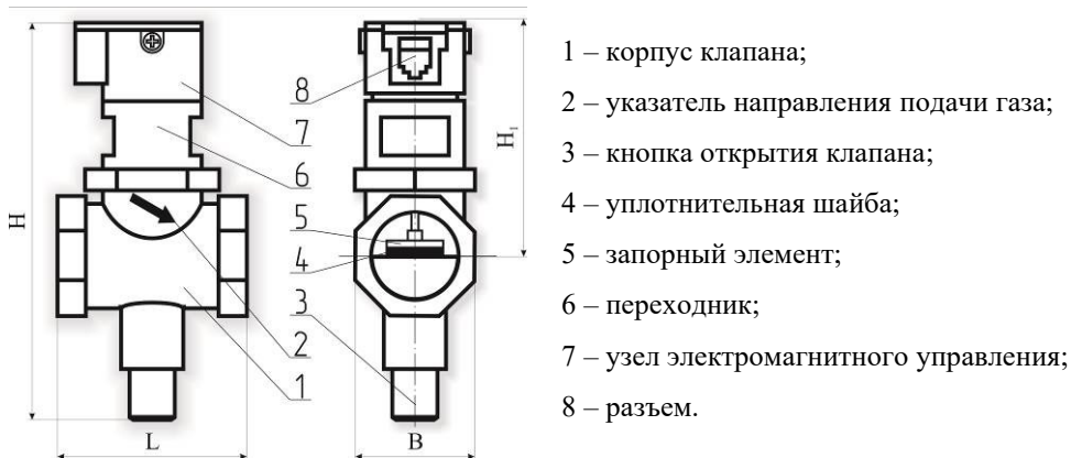
Рисунок 1 – Внешний вид клапана

Внешний вид клапана приведен на рисунке 1, схема электрическая принципиальная – на рисунке 2.