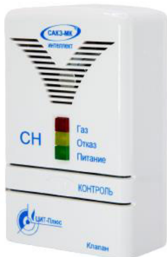
а) исполнение Аі

Общий вид сигнализаторов представлен на рисунке 1.