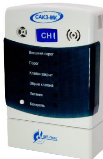
б) исполнения АГ, Г, ГТ, и Е