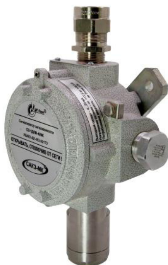
в) исполнение Д