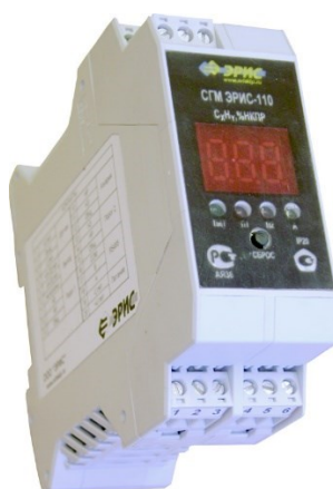
СГМ ЭРИС-110 В/Д, А/Д (потенциальный/токовый, DIN-рейка)