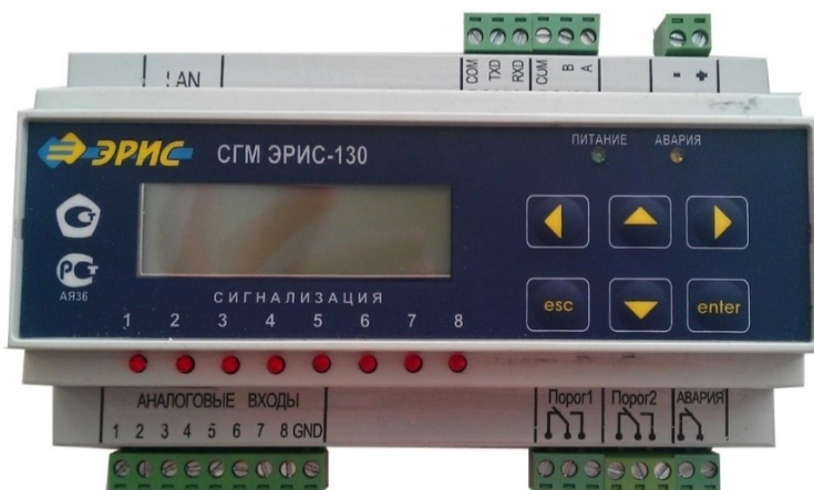
СГМ ЭРИС-130 (токовый, DIN-рейка) до 2015 года выпуска