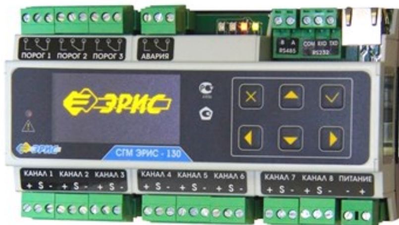
СГМ ЭРИС-130 (токовый, DIN-рейка)